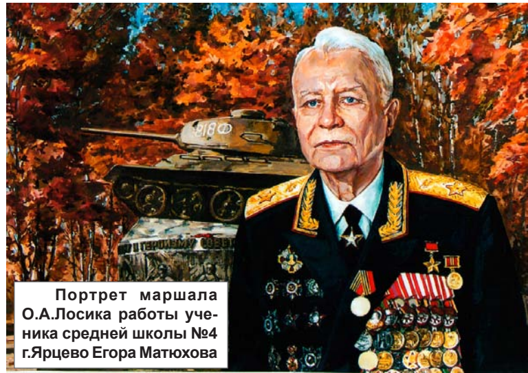
Портрет маршала О.А.Лосика работы ученика средней школы №4 г.Ярцево Егора Матюхова

торизованной и танковых дивизий. Окраины города опоясала мощная цепь инженерных оборонительных сооружений. Но стремительный рейд советских танкистов нарушил все планы врага.